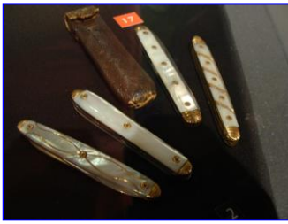
petits couteaux en nacre

Le musée est très riche d'objets anciens d'une qualité et d'une préciosité extraordinaire.