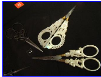
petits ciseaux de brodeuse