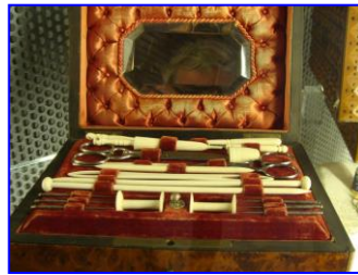
nécessaire de brodeuse